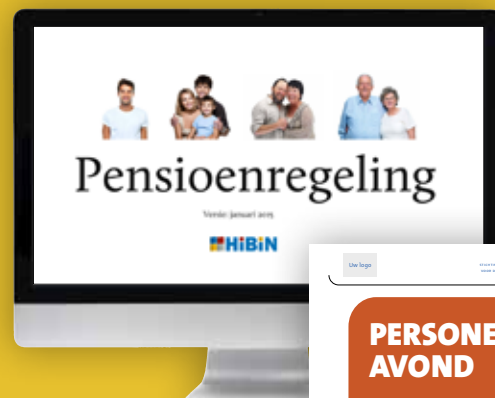
Presentatie met toelichting